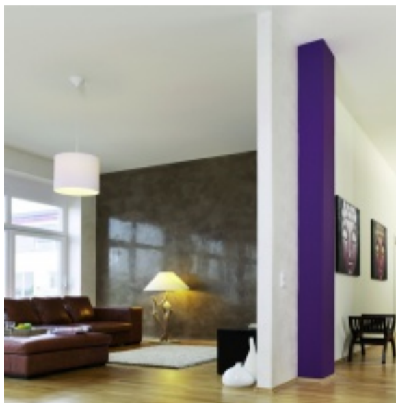
Lichtreflektionen bewirken auf der spiegelglatten Oberfläche immer wieder wechselnde Eindrücke und Stimmungen.

Raffinierte Tiefenwirkung, transparente Mehrschichtigkeit: Wandbeläge mit hochwertigen Effektschichtungen gelten als Oberflächentechnik der besonderen Art. Die unterschiedlichsten Dessins entfalten ihre außergewöhnlichen gestalterischen Möglichkeiten, wenn sie mit abgetönter Deco-Lasur beschichtet werden.