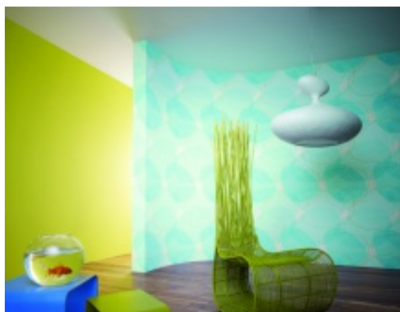
Erlaubt ist, was gefällt

Akzentuierte Bereiche in Wohn- und Geschäftswelt bieten sich für viele Motive an. Gerne beraten wir Sie mit entsprechenden Kollektionen.