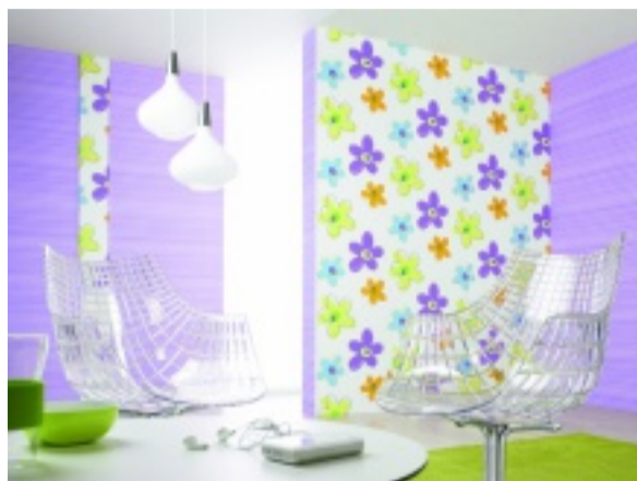
Trendig: Tapeten im Retrolook

Mit großformatigen Tapeten lassen sich Räume bestens gestalten.