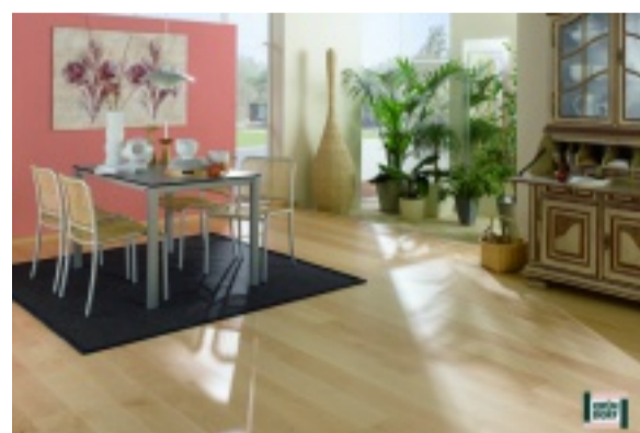
Laminatboden: extrem strapazierfähig

Wer jedoch Wert auf höchste Strapazierfähigkeit ohne bleibende Eindrücke legt, ist mit einem Laminatboden auf der sicheren Seite. Moderne Laminatböden sind in Bezug auf die Optik, Oberflächenstrukturen und Abmessungen vielfältig und kaum von echtem Holz zu unterscheiden. Sowohl beim Parkett, als auch beim Laminat reicht nebelfeuchtes Wischen mit entsprechenden Reinigungs- und Pflegeprodukten aus, um den Wert Ihres Bodens lange zu erhalten.