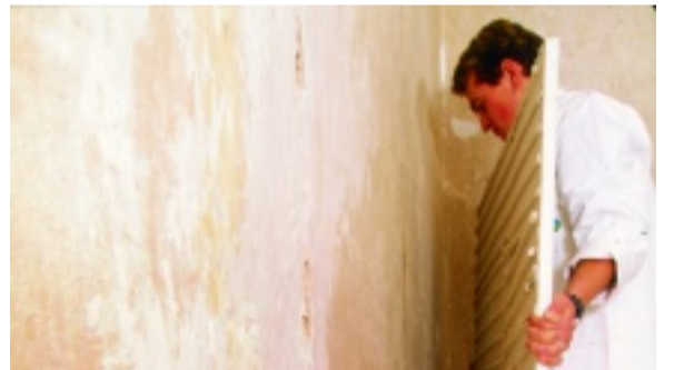
Schnell, effektiv und einfacher als Außendämmung anzubringen

Eine Innendämmung als energetische Sanierungsmaßnahme kann häufig kostengünstiger und zeitsparender als eine Außendämmung durchgeführt werden. Bei denkmalgeschützten und erhaltenswerten Fassaden oder bei Klinkern kommt eine Dämmung außen ohnehin nicht in Frage. Ebenfalls problematisch sind Gebäude, die zu nah an der Grundstücksgrenze stehen. Auch bei Besitzern von Eigentumswohnungen ist diese Art der Dämmung zunehmend beliebt, da sie keine Genehmigung der anderen Eigentümer erfordert.