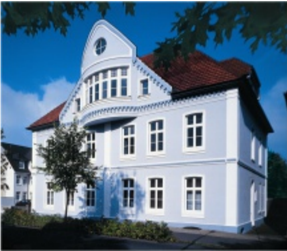
Frontansicht einer liebevoll gestalteten Fassade

Auch wenn die Fassade architektonisch uninspiriert aussieht oder eine Fassadendämmung das Haus langweilig erscheinen lässt, so kann man mit ansprechenden Profilen Akzente setzen.