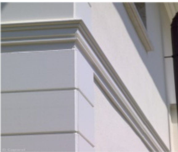
Detailansicht einer Fassade mit Bossensteinen

Fenstereinfassungen, Fensterbänke, Bossensteine oder Türeintrahmungen sind beliebte Bausteine zur Auflockerung von Fassaden. Die Profile können farblich nach Wunsch gestaltet werden.